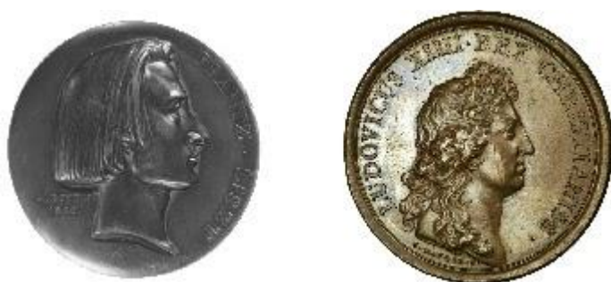
FIGURA 2 - À esquerda uma medalha com o perfil de Franz Liszt esculpida por Jean François Bovy em 1840. À direita uma de Luis XIV, rei da França feita no século XVII.

Se atualmente não é nenhuma surpresa ver um busto de um compositor ou artista, o mesmo não poderia ser dito antes do século XIX. A capacidade da escultura de perpetuar figuras fez com que ao longo de sua história ela se ocupasse principalmente de representações de divindades ou de pessoas com alto poder político (o que, por muito tempo, também tinha um caráter religioso). No começo do século XIX, porém, escultores como Davi d’Angers (1788-1856) ou Jean François Bovy (1795-1877) ocuparam papel central na produção de esculturas, bustos e medalhas de artistas e compositores.